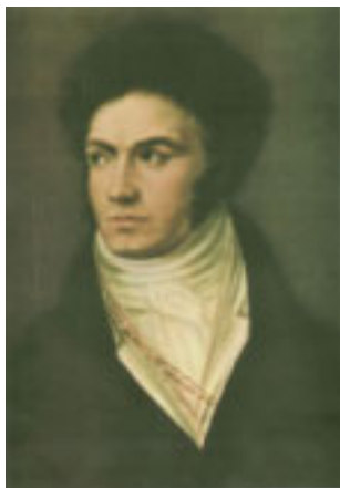
7. Beethoven um 1806. Gemälde von Isidor Neugass