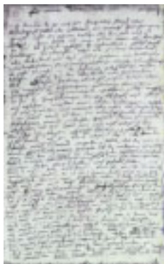
3. Das Heiligenstädter Testament (1802; S. 1)