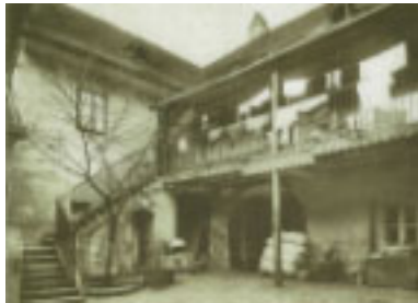
2. Das Beethoven-Haus in Heiligenstadt.