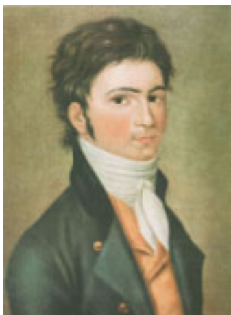
4. Beethoven um 1800. Anonymes Ölgemälde