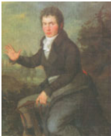
6. Beethoven um 1804. Gemälde von Willibrord Mähler