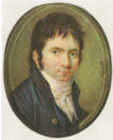
5. Beethoven um 1803. Miniatur von Christian Hornemann